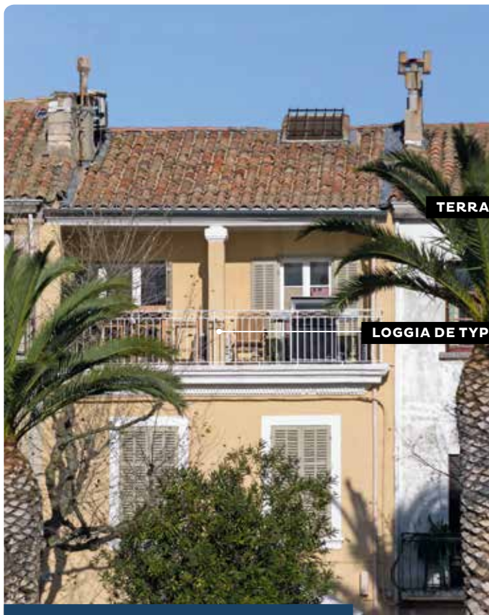
TERRASSE DITE « MARSEILLAISE »