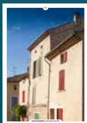
15 le confort thermique

Chaque intervention sur les façades de nos centres anciens compte et participe à l'harmonie du paysage urbain. Au cœur de nos villes et villages, l'intérêt particulier et l'intérêt général doivent être conjugués pour créer le cadre de vie que nous y recherchons tous.