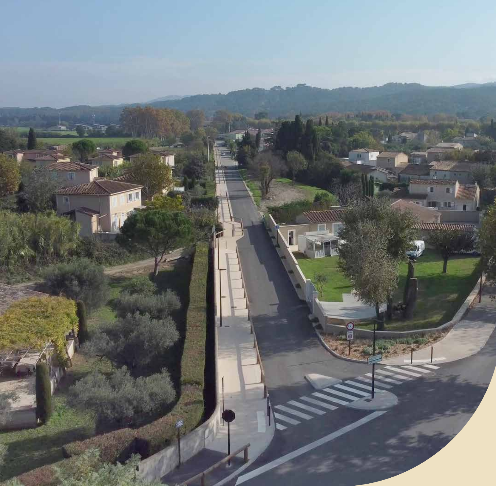
Le chemin de la Malautière